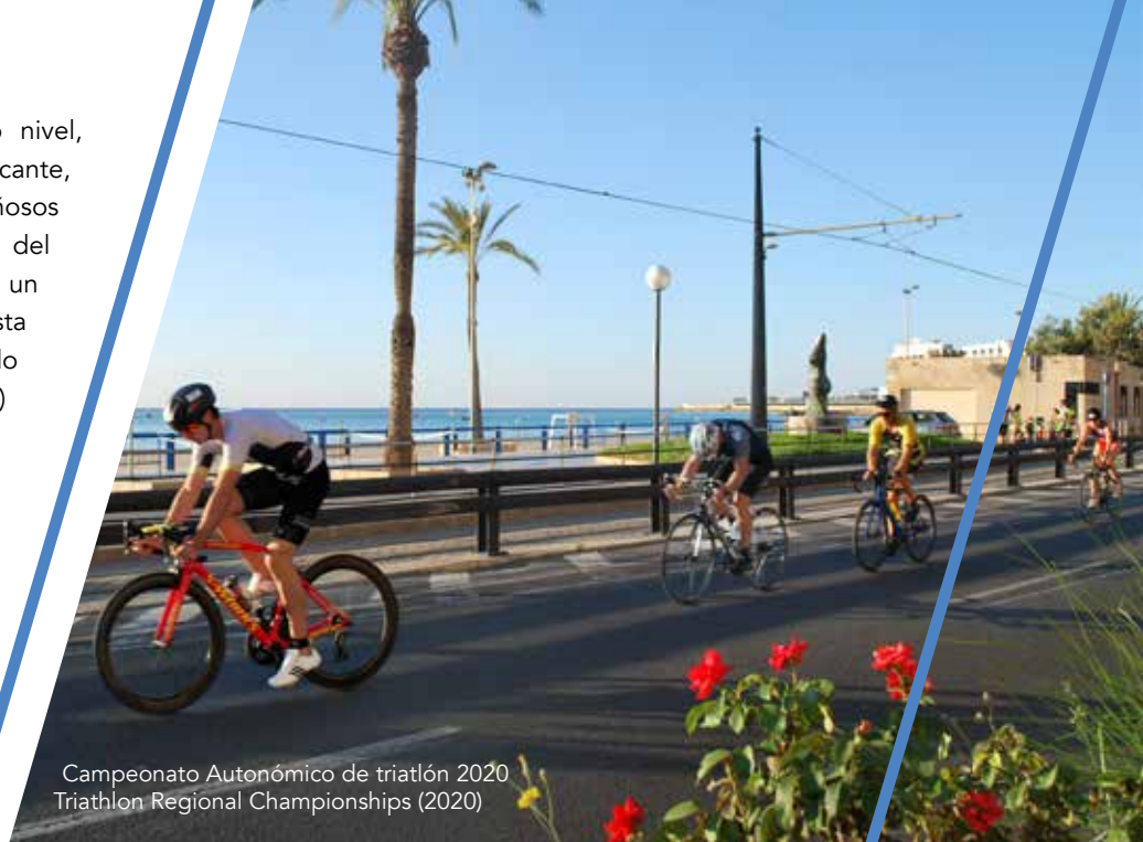
Campeonato Autonómico de triatlón 2020 Triathlon Regional Championships (2020)

Alicante province offers professional and high-level athletes one of the most mountainous landscapes in Spain, adapted to road and mountain cycling in a natural environment. This geography has been the protagonist of a number of internationally renowned competitions (see routes on p. 53).